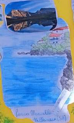
Parco Nazionale Vulturno (SA)

Il parco nazionale è un'area protetta che ha lo scopo di conservare la natura e il paesaggio. È un luogo dove si possono ammirare bellezze naturali e culturali. In Italia ci sono 16 parchi nazionali, ognuno con le sue peculiarità. Sono luoghi dove si può godere la natura e imparare molto.